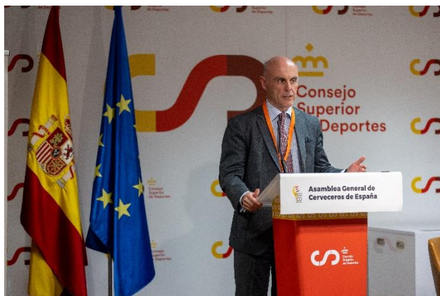
Alejandro Abellán García, director general de Coordinación del Mercado Interior y otras Políticas Comunitarias

En el marco de esta Asamblea, se destacó también la estrecha relación histórica del sector cervecero con el deporte, coincidiendo con el quinto aniversario del compromiso de Cerveceros de España en este ámbito. En concreto, se compartió que el sector cervecero, en el año 2022, invirtió más de 41 millones de euros en apoyar al deporte español, patrocinando a cerca de 100 entidades deportivas que abarcaban más de 20 disciplinas diferentes. Esta inversión incluyó no solo a deportes y clubes de gran tamaño, sino también a otros más modestos o de prácticas minoritarias, lo que demuestra su compromiso con la promoción de un estilo de vida activo, equilibrado y propio de nuestra cultura mediterránea.